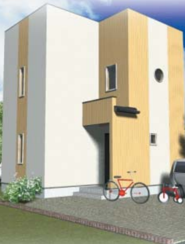
※パースは会場建物と一部異なります。