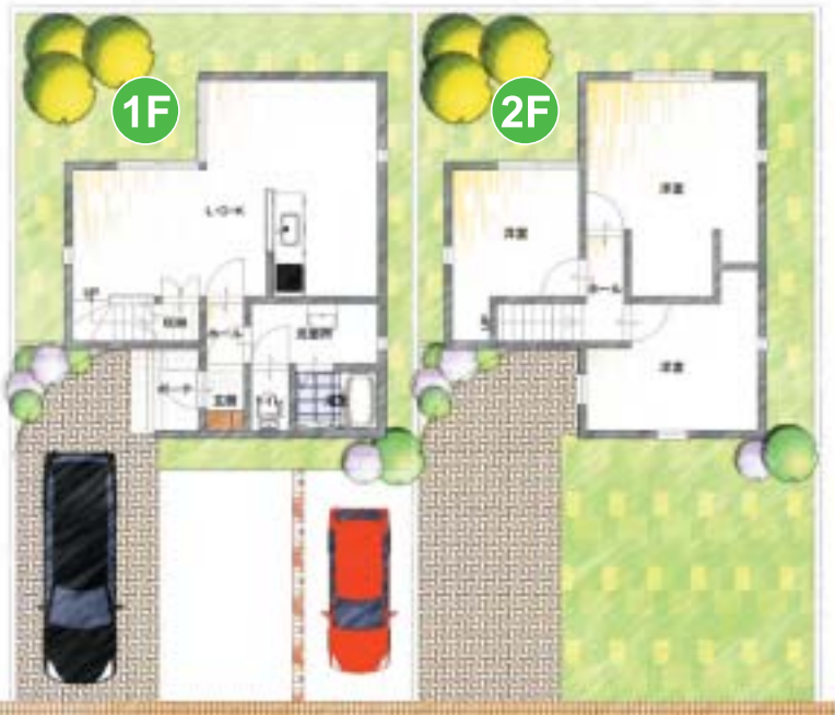
《建物面積》1階床面積 / 11.02坪 2階床面積 / 11.02坪 延床面積 / 22.04坪